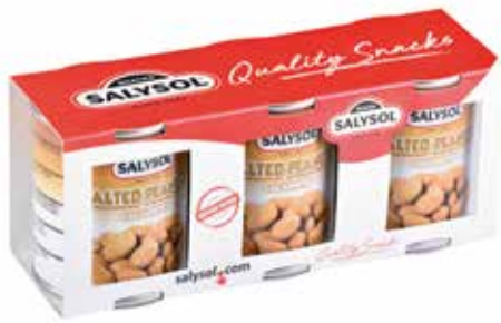
PACK 3 tins