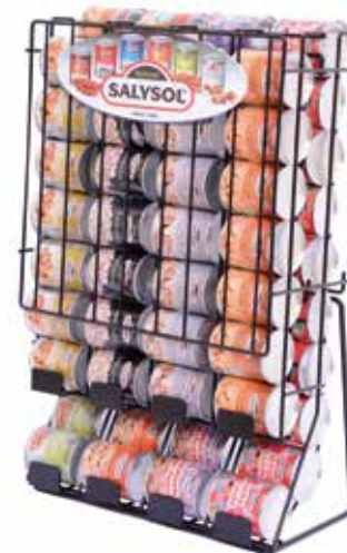
METAL DISPLAY 68 tins