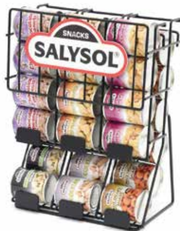
METAL DISPLAY 30 tins