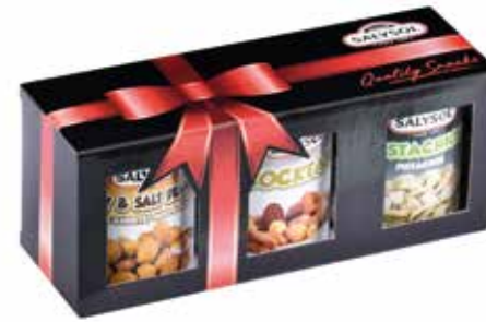
PACK 3 tins DELUXE