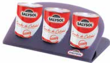
PLASTIC DISPLAY 3 tins