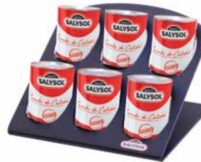
PLASTIC DISPLAY 6 tins